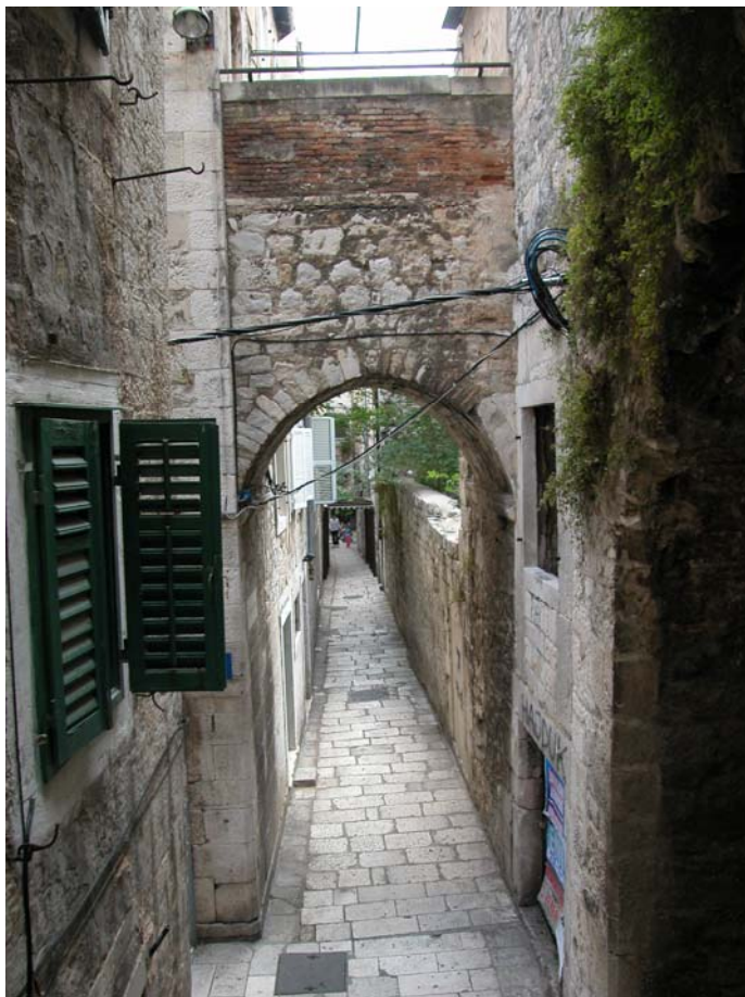
SPLIT – GETTO

Ovaj tekst je usporedba historijski uspostavljenih Jevrejskih habitata iz istog historijskog razdoblja, ali u drugačijim historijskim i socio-političkim uslovima. Zašto? Zato što je uvijek postojala dinamička interakcija između razvijenih urbanih područja, sa različitim historijskom pozadinom, i unutar njihovih novoodvojenih dijelova kreiranih da postanu Jevrejski habitat – vrsta "Grada u gradu". I ta nova kreacija izazvala je čitav niz novih pitanja za jevrejske stanovnike koji su bili prisiljeni, ili u nekim slučajevima nagovoreni, da se nasele u tim područjima (zvanim Ghetto u kršćanskom svijetu, i Mahale ili Melahe u Muslimanskom svijetu).