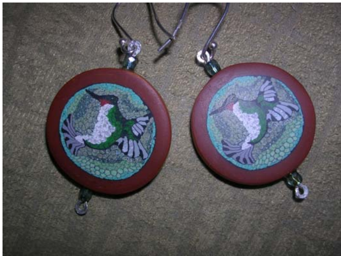
Minduše – mozaik